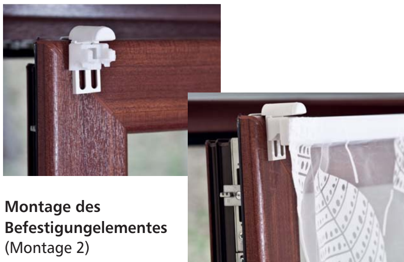
Montage des Befestigungselementes (Montage 2)