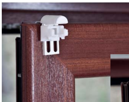
Montage des Befestigungselementes (Montage 2)